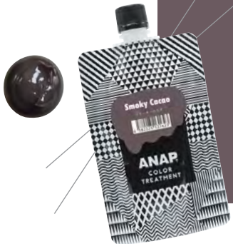
◀ ANAP カラートリートメント スモーキーカカオ 150g

アッシュな仕上がりのブラウン。 ムラサキをほんのりを感じられる 濃すぎないナチュラルカラーです。 クリアで薄めるとミルクティーカラーに。