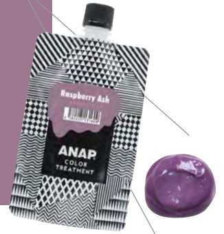
ANAP カラートリートメント ラズベリーアッシュ 150g ▶

パープルよりの落ち着いたピンク色。 ほどよい“くすみ感”で肌なじみがよく 使いやすいカラーです。 ビビッドになりすぎず、こなれた雰囲気。