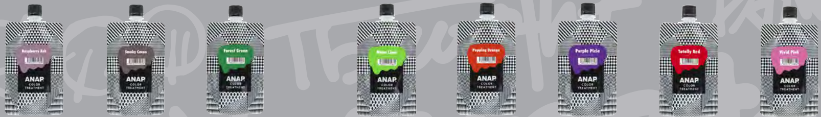
ラズベリーアッシュ スモーキーカカオ★ フォレストグリーン★ ネオンライム★ ポッピングオレンジ★ パープルピクシー★ トータリーレッド ビビッドピンク★